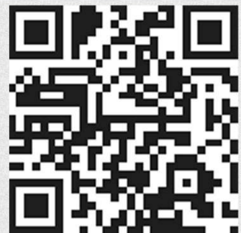
مقام شایسته تقدیر انجمن برتر دوازدهمین جشنواره بین المللی حرکت