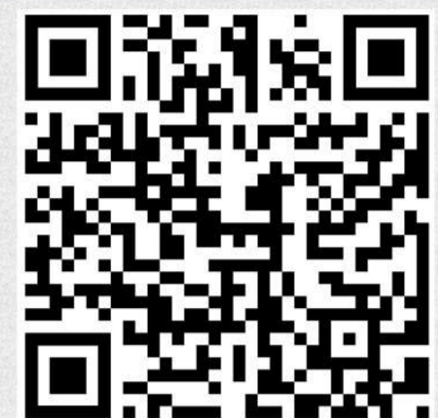
رتبه نخست فضای مجازی و محتوای دیجیتال سیزدهمین جشنواره بین المللی حرکت